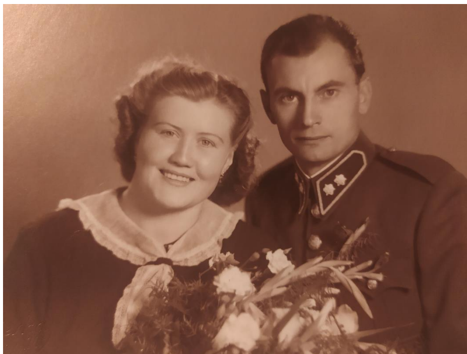
Manželská fotografie