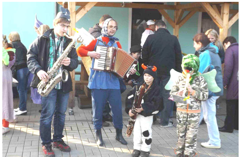
... a muzikanti hrají k radosti všech účastníků