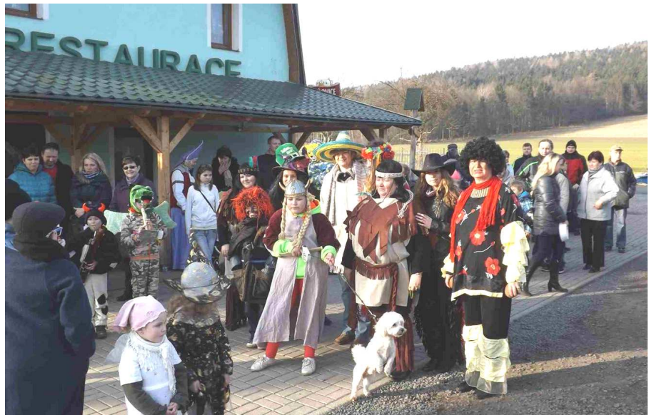
Masopustní průvod přichází ...