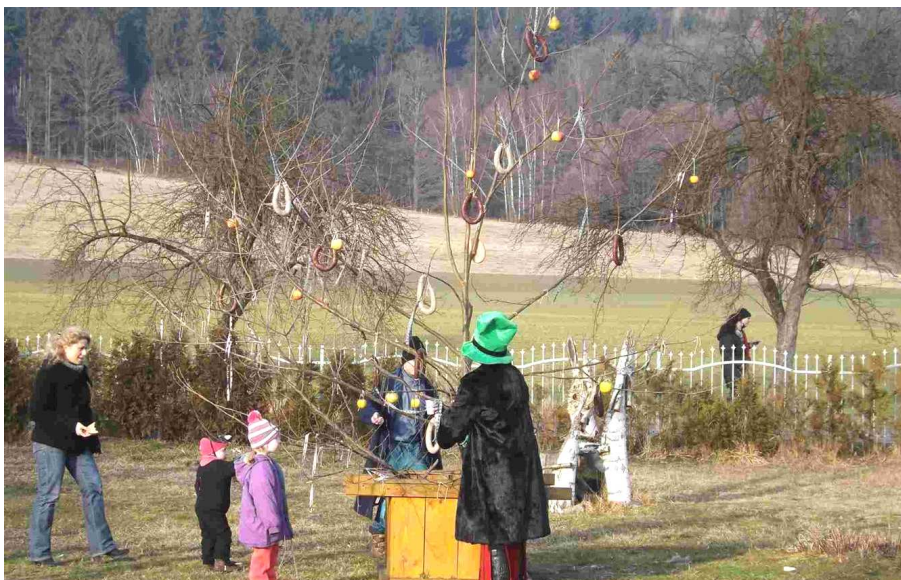
Stromek hojnosti se těšil zasloužené pozornosti