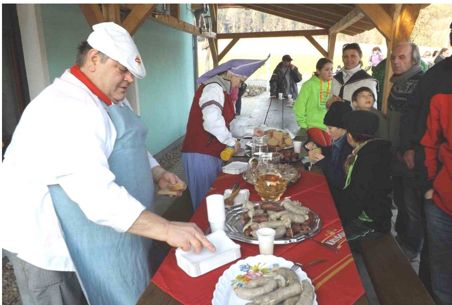
Dobré chutnání všem!

výzva dopadne. K radosti nás všech, tedy organizátorů i účastníků, myslím, že se věc podařila. V daný den se kolem 15ti hodin u školy pomalu tvořil hlouček masek, zvědavců, dětí i pozorovatelů. Všichni byli přivítáni pečnými masopustními šíškami a sladkými buchtami.