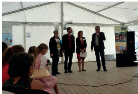
PŘIPOMENUTÍ 15 LET MAS SEVER

snažil brát to dobré z myšlenek více partají. Členství ve straně by defacto znamenalo funkci navíc, což jsem nechtěl. Plně jsem se chtěl soustředit na Vilémov.