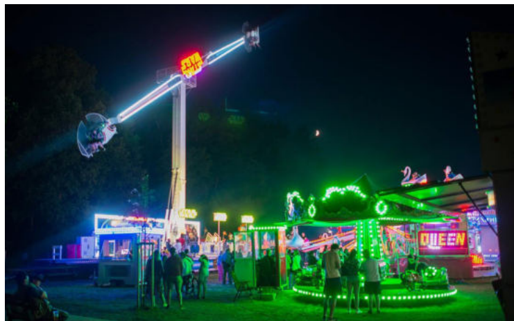
VŠECHNY FOTOGRAFIE Z AKCE NALEZNETE NA WWW.VILEMOV.CZ