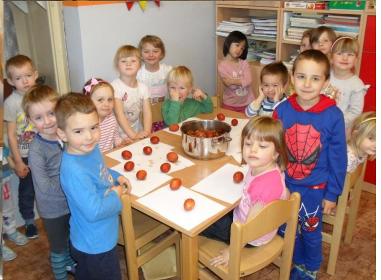
Jaro ve škole