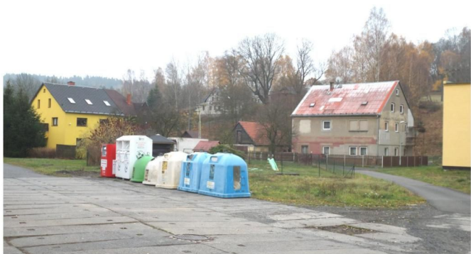
Nové umístění kontejnerů