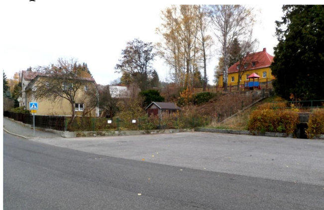
Místo původního umístění kontejnerů