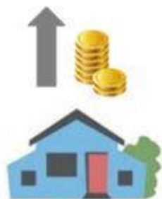
KOTLÍKOVÁ PŮJČKA OD OBCE KRYJE 100 % CENY KOTLE