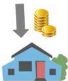
SPLÁCENÍ KOTLÍKOVÉ PŮJČKY OBCI