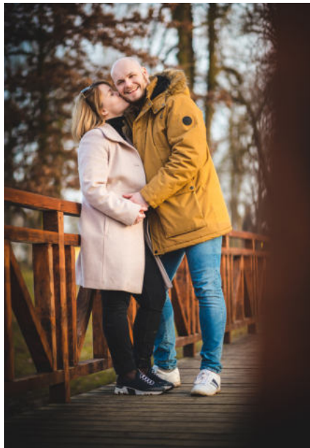
NEJML

řádek v přírodě, dále posprejované budovy, pohozené injekční jehly na dětských hřištích, poničené mobiliáře měst a obcí a podobně. Nechci být ale negativní a už vůbec házet lidi do jednoho pytle. Jsou mezi námi našťástí i slušní, tolerantní a obětaví lidé a myslím, že jich je stále většina.