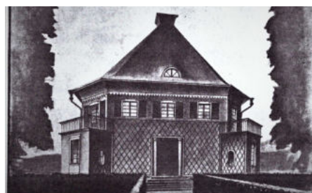
ZDROJ: Wahsmuths Monatshefte für Baukunst und Städtebau, Jahrgang VII, S. 376-380. Archiv: Klaus Brendler

Velká funkcionalistická stavba je vidět vlevo na svahu směrem do Krásné Lipy na Kyjovské ulici. Budově se ve své době přezdívalo „Opičí chlív“ nebo také „Pavilon opic“. Pro mnohé konzervativní obyvatele Krásné Lipy, zvyklé na honosné a zdobené vily, mohla stavba působit jako moderní „opičárna“, dnes je však budova hodnotným příkladem funkcionalismu v architektuře. Dnes se v budově nachází ústav sociální péče.