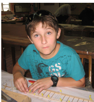
Nevinný pohled jinak pěkně živého Pěti Blaschky