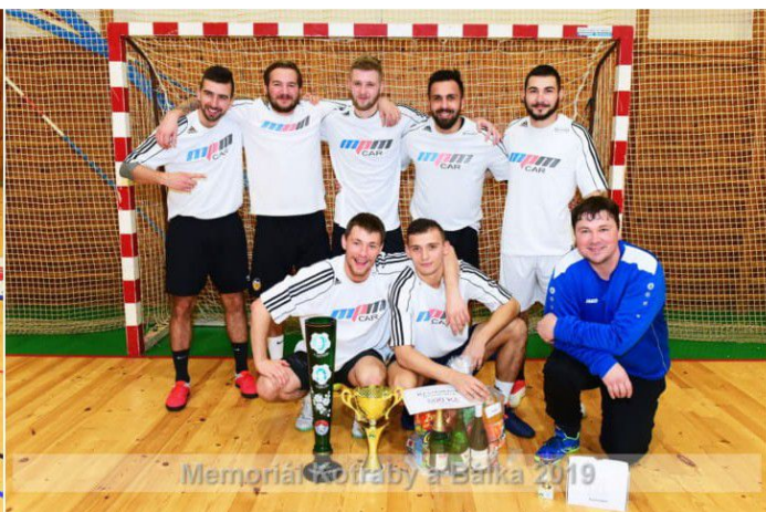
Memoriál Kotraby a Bálka 2019