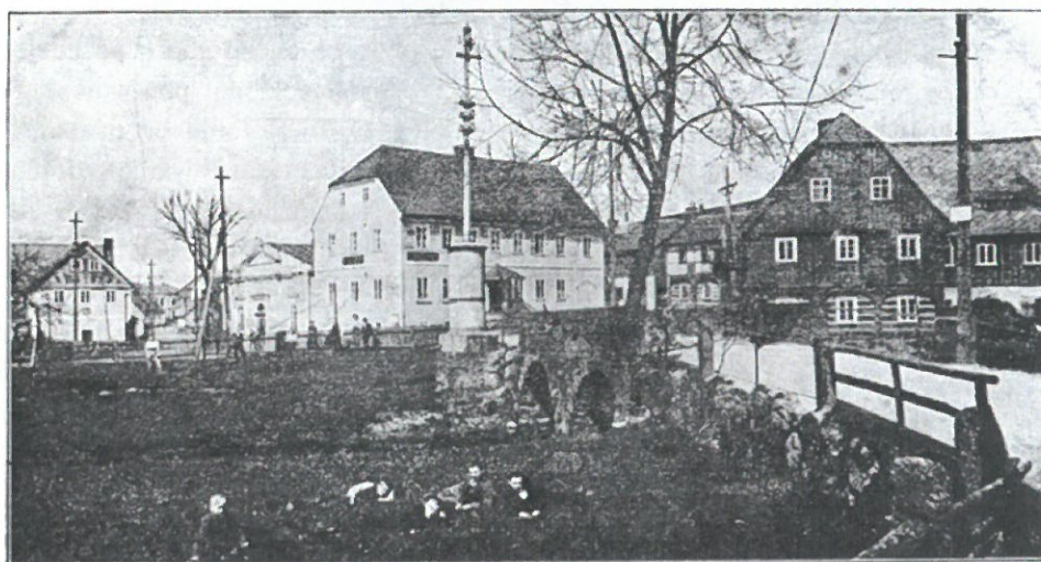
Gruss aus Wölmsdorf