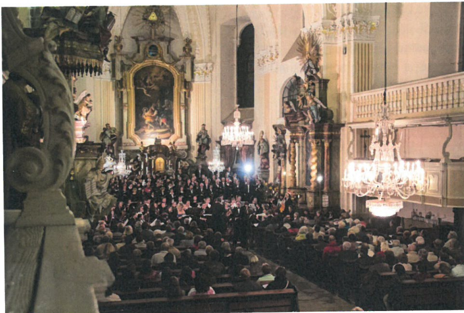
Verdiho Requiem ve Šluknově