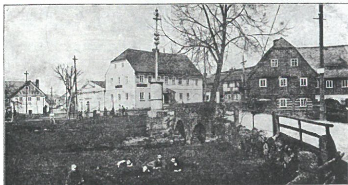
Gruss aus Wölmsdorf.

stojí mandl, proto nelze snímek pořídit ze stejného úhlu.