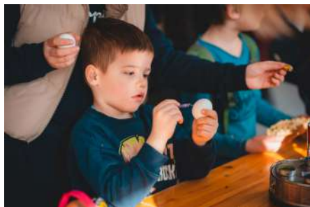
NEJML

lit, měli možnost a poté si mohli svůj výrobek odnést domů.