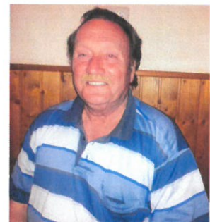
pan Karel Brückner.

V neděli 7.května to bude právě rok co nás navždy opustil náš velký fanda, Vilémovský i Varnsdorfský srdcař, člen výboru našeho Fanda klubu, spolehlivý brigádník, skvělý člověk a hlavně správný chlap