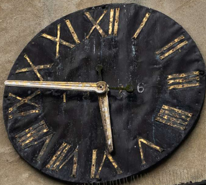
NEJML