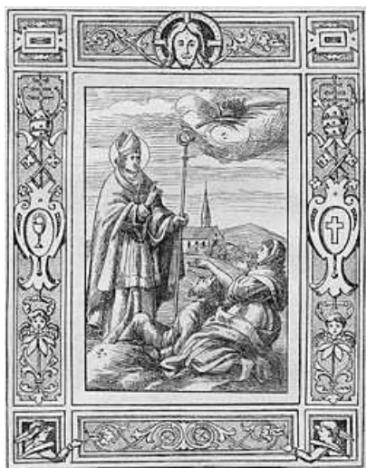
Sv. Valentin léčí nemocného

Svátek sv. Valentýna se slaví v anglosaských zemích každoročně 14. února jako svátek lásky a náklonnosti mezi intimními partnery. Ti si v tento den posílají dárky – květiny, cukrovinky a hlavně pohlednice se stylizovaným srdcem jako symbolem lásky a s přáníčky - tzv valentýnky . Malý příklad: