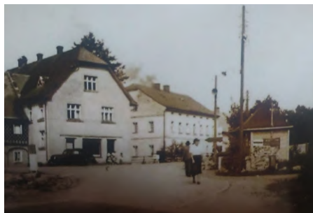
Vysloužilá trafika z centra obce putovala na nově založené fotbalové hřiště, kde sloužila k mnoha účelům