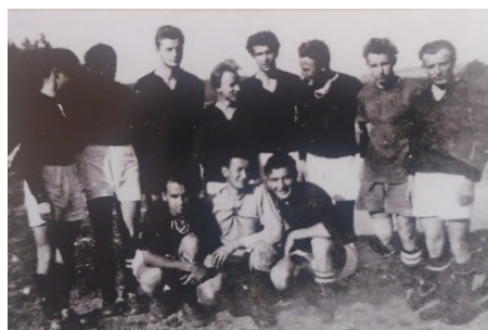
Nejstarší fotografie vilémovských fotbalových průkopníků, kteří začínali na louce za dnešním Siopsem. Identifikace jednotlivých aktérů se nepodařila. Zřejmě v této sestavě tehdy tak překvapivě poslali domů Šluknováky s rychtou 7:0

Místní fotbalisté nepatřili zrovna k průkopníkům tohoto sportu ve výběžku. Všude v okolí měli určitou výhodu v tom, že se tam hrálo už před válkou a jako dědictví po původních osídlencích zůstalo určité zázemí, jako například kdysi vybudovaná hřiště. Takové výhody měli třeba v Poustevně, Mikulášovicích, Šenově, Rumburku.