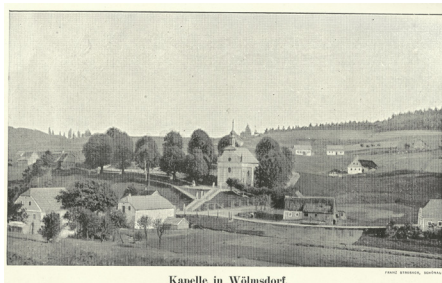
Kapelle in Wülmsdorf.